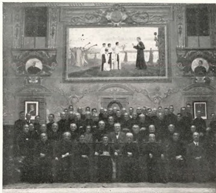
Decurioni intervenuti al convegno di Lanzo Torinese.

Il secondo si tenne, il 13 giugno, a Pinerolo ,