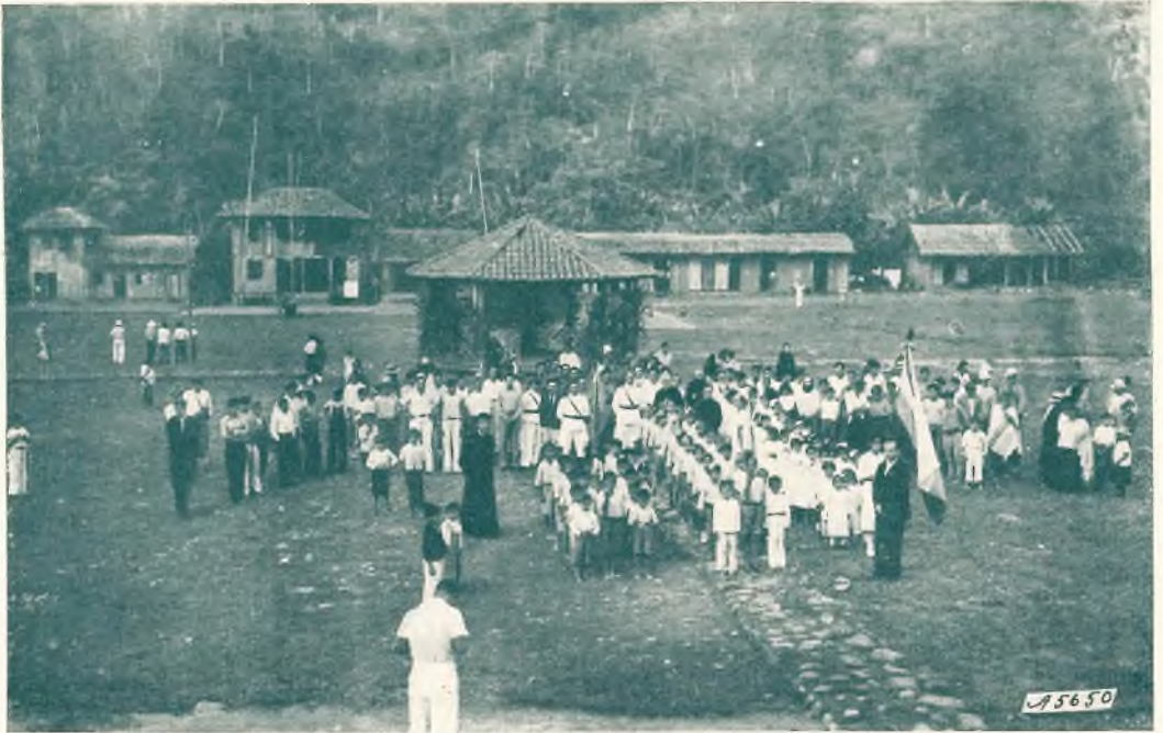
Mendez. - Gruppo generale dopo la messa campale celebrata da Mons. Comin.