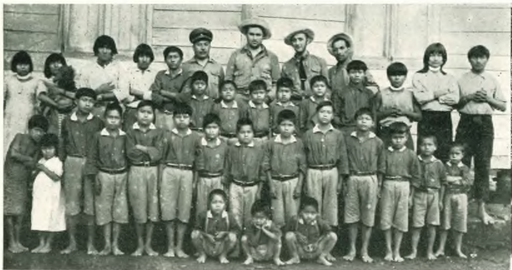
Mendez. - S. E. il Ministro Galo Lasso coi personaggi del seguito tra i Kivaretti interni della nostra Missione.