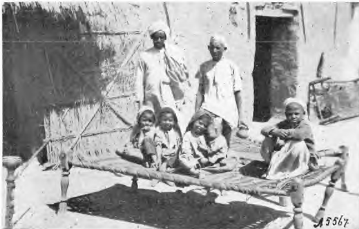
Saharanpur. - Piccoli paria al sole.