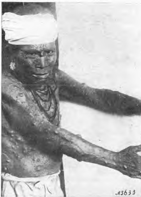
Tura. - Un lebbroso Garo.