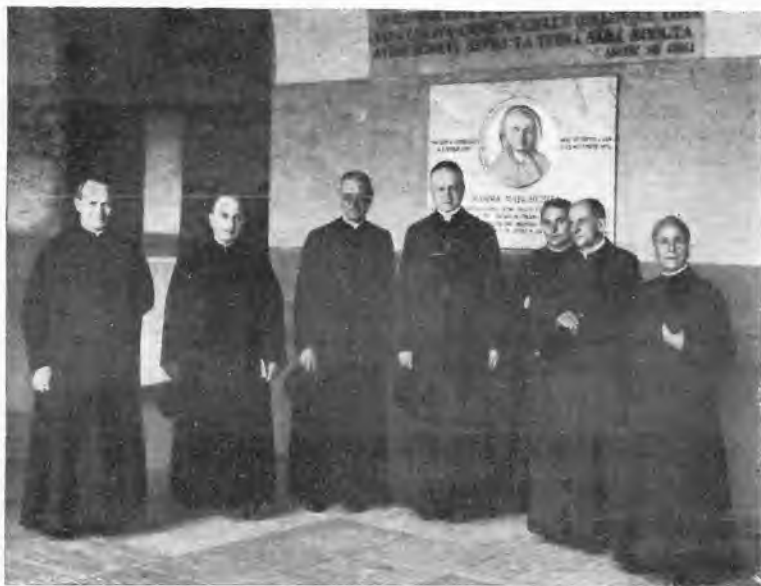
Torino. - S. Em. il Card. Tedeschini in visita alla Casa-madre.

Non meno generale e commovente fu poi, dopo l'incendio, alla sera dell'indomani, la sollecitudine della gente del paese nel portare i primi soccorsi in denaro o in generi; perfino i poveri recarono la loro offerta, magari solo di pochi centesimi.