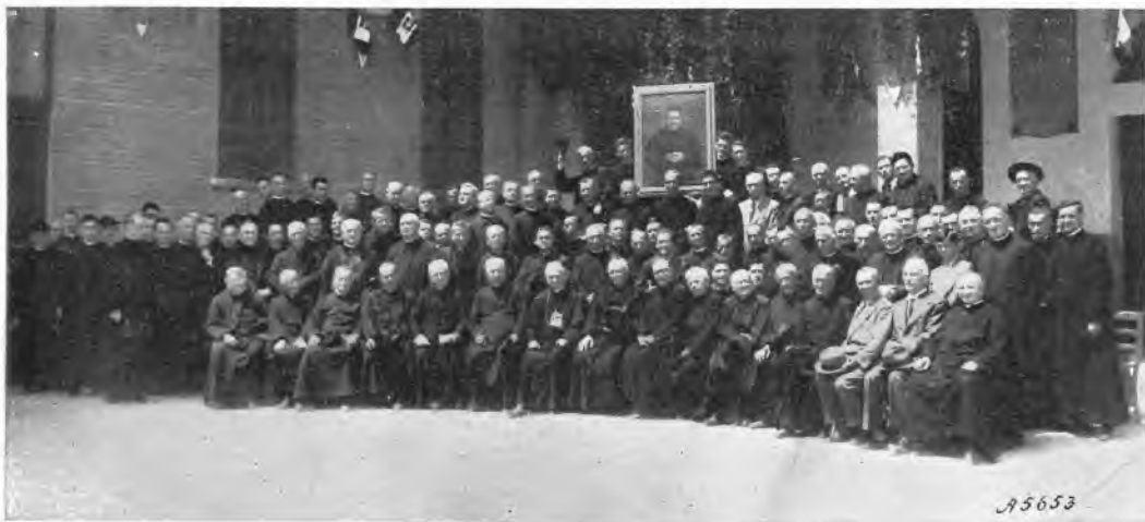
Asti. - Decurioni salesiani attorno a S. E. Mons. Vescovo e al Rettor Maggiore.