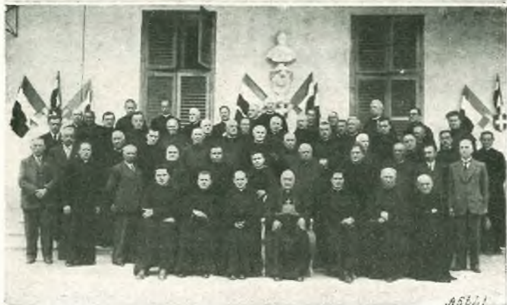
Dall'alto in basso: Decurioni intervenuti ai convegni di Avigliana, Castelnuovo Don Bosco, Lombriasco.

Il primo si tenne, il 1° giugno, nella Scuola Agricola Salesiana di