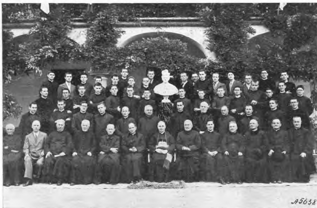
Pinerolo. - I nostri Ascritti fan corona all'Ecc.mo Mons. Vescovo ed ai Decurioni salesiani.

3 o la partecipazione dei Decurioni e dei Cooperatori salesiani alla crociata catechistica, suscitavano ovunque nuovo fervore di apostolato.