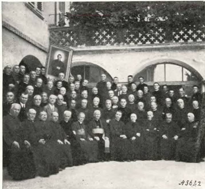
Decurioni intervenuti al convegno di Nizza Monferrato.

Lombriasco , per la diocesi di Saluzzo e la plaga di Lombriasco, coll'intervento del Vescovo di Saluzzo, S. E. Monsignor Giovanni Oberti, e di una sessantina di decurioni.