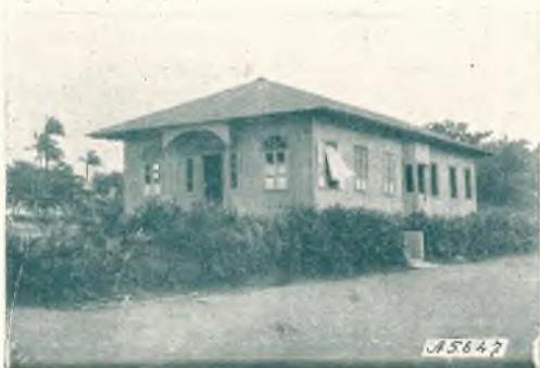
Macas. - La cappella della Missione "Sevilla D. Bosco".

questa mia doveva essere già in viaggio per recarle il saluto e gli auguri di tutti i confratelli di questa Missione. Il lavoro di queste ultime settimane mi ha impedito di compiere a suo tempo il mio dovere; d'altra parte il ritardo mi porge occasione di darle notizie, che certo le arrecheranno piacere. Abbiamo trascorso con molto fervore il mese mariano.