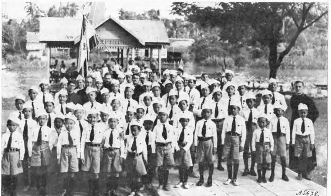
Fiori di missione: I giovani alunni della Scuola salesiana della Missione di Banpong (Thailandia).

Pregiere, offerte, sacrifici, grandi o piccoli non importa: ecco la parte nostra, tanto più utile, quanto più costante e periodica. Tutti abbiamo il dovere di porgere la mano ai fratelli quando è in gioco la loro eterna salvezza. È precetto del Signore: « Date ai poveri ciò che vi sopravanza ». E non son tra i più poveri gli infedeli?